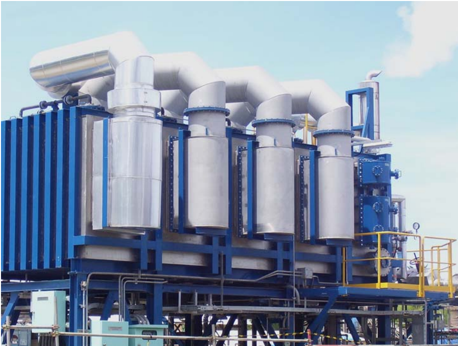
Vista generale di un impianto di dissalazione MSF.

za è comunque sensibilmente più ampia per gli impianti di potenzialità più elevata. Risulta meno rilevante invece la variazione della sua incidenza passando dallo scenario Italia rispetto a quello di un paese produttore di petrolio. Ad esempio, per un impianto da 30.000 m 3 /giorno l'incidenza dei costi variabili è di circa il 23% sul totale nel caso di paese produttore e del 25% nel caso Italia, mentre diventa del 33 e del 35%, rispettivamente, quando la potenzialità è pari a 100.000 m 3 /giorno.