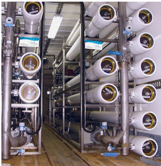
I moduli di un impianto di dissalazione RO.

Un'ultima considerazione deve essere fatta sull'impatto ambientale degli impianti di dissalazione. Gli effetti sull'ambiente non sono esattamente gli stessi per qualunque tipo di impianto. A solo titolo di esempio evidenziamo che da un impianto di tipo MSF viene immessa in mare una corrente di acqua di rifiuto a salinità e temperatura superiori rispetto a quelle presenti in mare nel punto di presa, mentre la tempe-