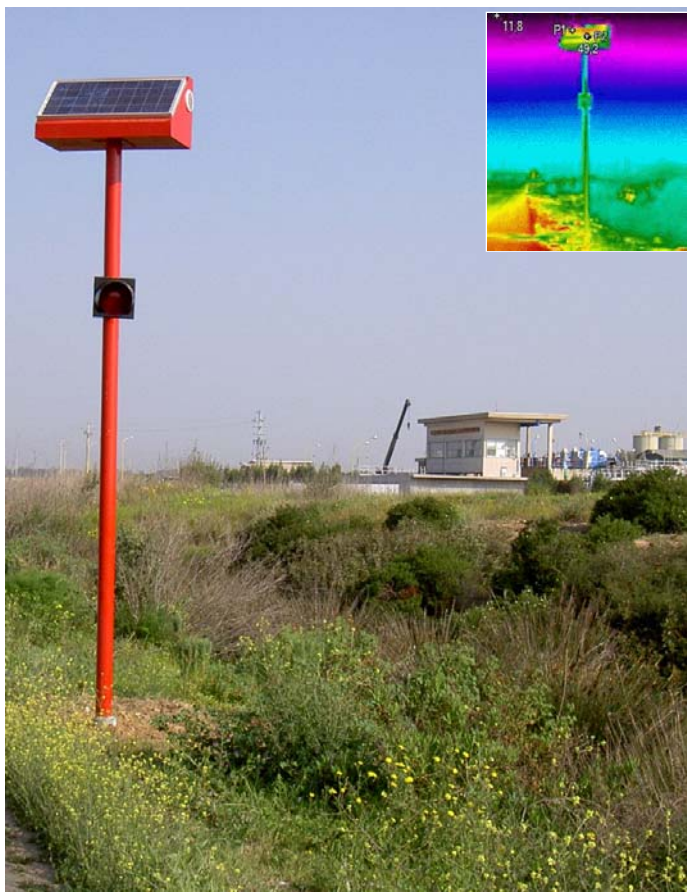
Un pannello fotovoltaico con celle in corto, evidenziate (P1 e P2) dall'immagine termografica nel riquadro.

ottimizzando il rendimento delle apparecchiature. L'analisi è talmente minuziosa che è possibile capire quali perdite di calore non sono visibili ad occhio e non vengono considerate nelle ipotesi standard dal calcolo della certificazione.