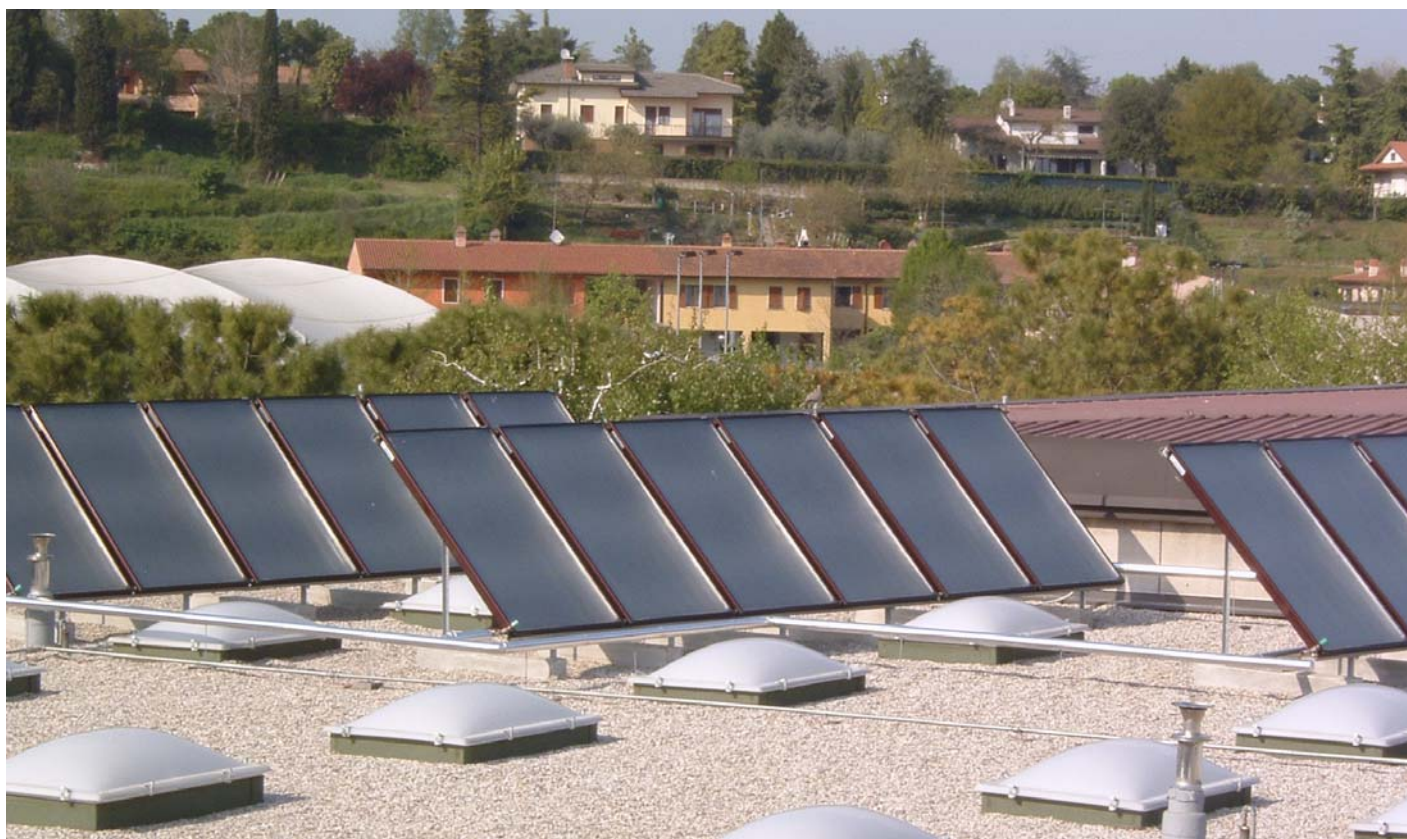
Pannelli solari per la produzione di acqua calda installati sul tetto di un impianto sportivo.

dividua obiettivi più stringenti rispetto alla legge di indirizzo nazionale, lasciando però in piedi l'impianto normativo da essa delineato, composto dal D. lgs. 192/05, dai decreti attuativi e dalle Linee Guida Nazionali di prossima emanazione.