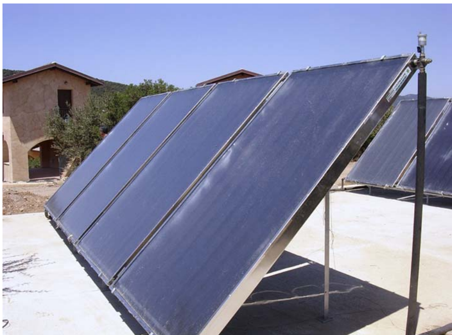
Pannelli solari per la produzione di acqua calda installati a terra.

Tra i profili più problematici derivanti dall'entrata in vigore del decreto n. 192 vi è senz'altro quello del rapporto tra tale fonte normativa ed eventuali leggi regionali di recepimento della direttiva comunitaria 2002/91/CE. A tal proposito, l'art. 17, norma conclusiva del decreto, contiene, in ossequio alla prescrizione di cui all'art. 11, comma 8 della legge 11/2005 (3) , l'espressa previsione della c.d. clausola di cedevolezza, in forza della quale, nelle materie di competenza regionale o provin-