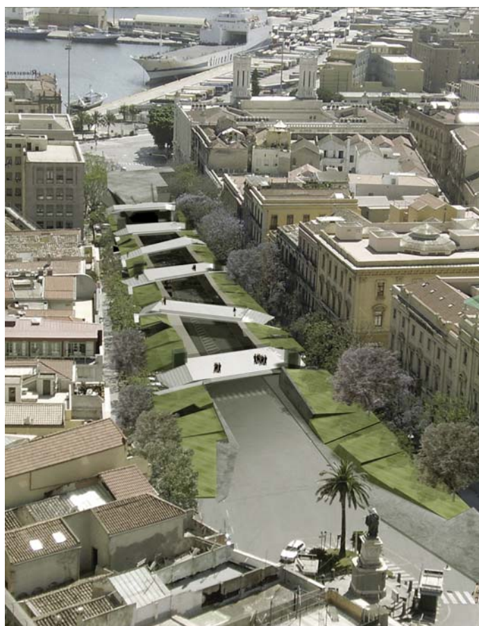
dal progetto "Ri_calcare calli fenicie"

Questo articolo è parte di un volume in pubblicazione per le Edizioni della Torre ed i Rotary Club di Cagliari.